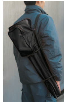
専用ケースは背負いバンド付