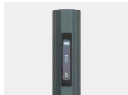
液晶表示パネル搭載