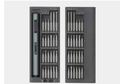
12種類・全48本のビット付属