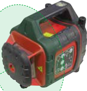
リモコン・受光器 標準装備

赤色レーザーに比べて約5倍(当社比)明るいグリーンレーザーを採用。 緑色は赤色に比べて比視感度が高く、視認性も抜群です。