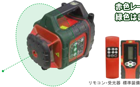
リモコン・受光器 標準装備

赤色レーザーに比べて約5倍(当社比)明るいグリーンレーザーを採用。 緑色は赤色に比べて比視感度が高く、視認性も抜群です。