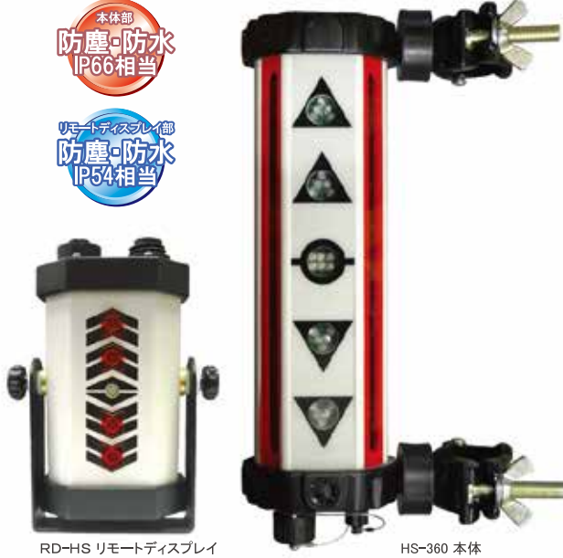
RD-HS リモートディスプレイ