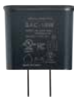
USB-AC アダプター SAC-10W