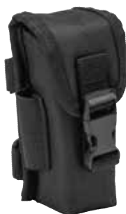
専用本体収納ケース SC-SR