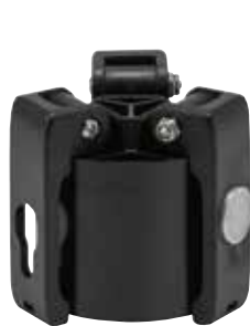
脚付保護キャップ CTR-SR