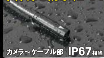
カメラ~ケーブル部 IP67相当

内蔵メモリ(128MB)の他 MicroSDカードにも 静止画・音声付動画データを記録可能