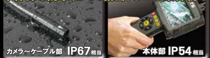
カメラ~ケーブル部 IP67相当

内蔵メモリ(128MB)の他 MicroSDカードにも 静止画・音声付動画データを記録可能