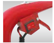
安全性重視のON/OFFスイッチ