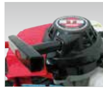
始動が簡単なリコイルスターター

標準付属品 ・本体 ・混合タンク ・ろと ・工具セット(ケース付) ・取扱説明書