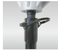
オーガの着脱は結合ピン1本で可能