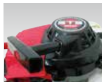
始動が簡単なリコイルスターター