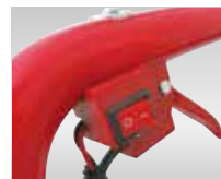
安全性重視のON/OFFスイッチ