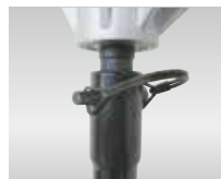
オーガの着脱は結合ピン1本で可能