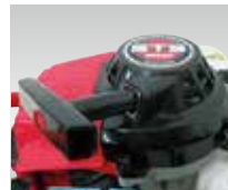
始動が簡単なリコイルスターター