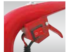
安全性重視のON/OFFスイッチ