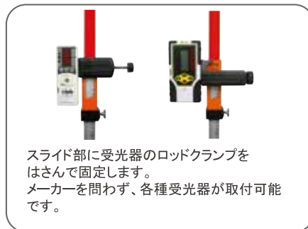
スライド部に受光器のロッドクランプをはさんで固定します。メーカーを問わず、各種受光器が取付可能です。