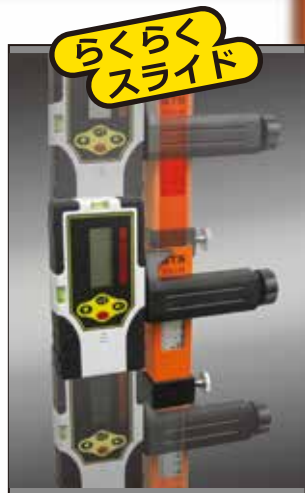
受光器のロッドクランプを外さなくてもスライドできます