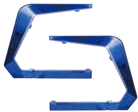
カスタムフレーム (ブルー) CF-SGT-B