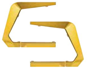
カスタムフレーム (ゴールド) CF-SGT-G