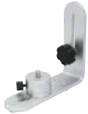
マグネット付 L 字金具 LM-2AC