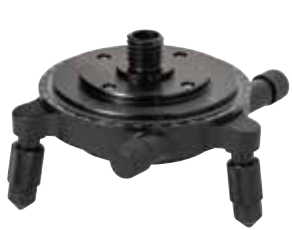
専用回転微動台座 TB-WR1