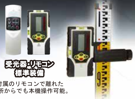
受光器・リモコン 標準装備