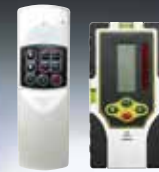
受光器・リモコン 標準装備