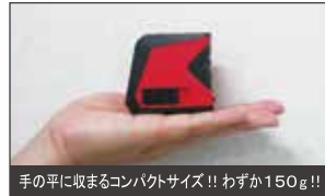
手の平に収まるコンパクトサイズ!! わずか150g!!