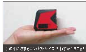
手の平に収まるコンパクトサイズ!! わずか150g!!

〈オプション〉 ・専用整準プレート TAP-3B 標準小売価格 ¥2,000 (税込: ¥2,200)