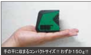
手の平に収まるコンパクトサイズ!! わずか150g!!

〈オプション〉 ・専用整準プレート TAP-3B 標準小売価格 ¥2,000 (税込: ¥2,200)