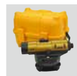
専用ハードケース