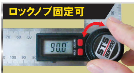
角度に合わせてロックノブで固定可能