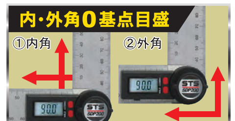
さしがね時に内・外角0基点目盛仕様