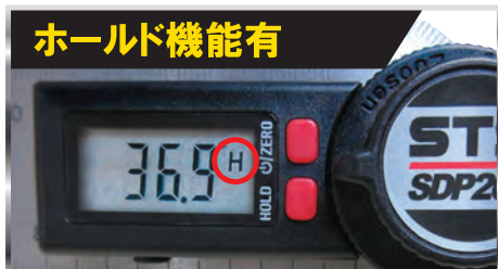
便利な測定値ホールド(H)機能付き